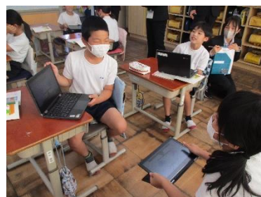
タブレットを使って話し合う授業 (自分の意見を入力すると、学級全員に内容が伝達される)

ICT（タブレット）を活用した授業が更に盛んになり、課題解決に必要な情報を調べる際や意見交流の際に積極的に活用する児童の姿が当たり前になってきました。教師側もデジタル教材等を用いた指導（ICT機器による資料の提示など：音声や動画も含む）を進めています。今後も活用場面を考えながら推進していきます。