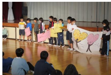
「思いやり宣言」報告会での 1年生の発表の様子

活動を通して、主体的な児童の動きと、自分たちの力で学校を高めようとする意欲が高まりつつあります。今後は、「値打ちのある活動を生み出す」ことや「より価値の高い姿に挑戦する」ことにも取り組んでいきたいと思えます。