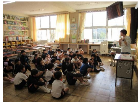
対面での読み聞かせの様子

朝活動の時間に、PTA子育て委員会（旧母親委員会）の呼びかけに応じてくださったボランティアの皆さんが、各学級で読み聞かせをしてくださいました。ボランティアさんが「命」に係わる内容の本を選んでくださいました。真剣に話を聞く姿がたくさん見られました。