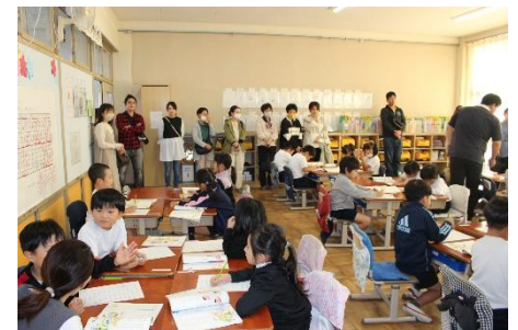
全校道徳の授業の様子

朝の会では、「命の歌」を、（おそらく）4年ぶりに、声を出して歌いました。この歌は、命が繋がっていることに気づき、その大切さを歌ったものです。この日のために練習を重ねてきました。