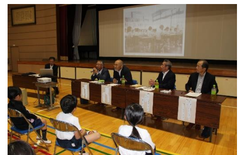
「命」の講演会の様子

2・3時間目は、「命」の講演会を行いました。今年は、稲津に学校ができて150年ということで、テーマを「150年つないだ命・150年つなぐ命」としました。まず、先人からずっと命が繋がって、今の自分が生きていることが奇跡であり、素晴らしいことだと確認しました。その後、この150年間、稲津小学校や稲津町がどのように変化発展してきたかを知り、どの時代も、子供たちは元気よく生きてきたこと、先人たちが、地域の産業を興し、力強くかつ粘り強く生きてきたことなどを感じるとることができる内容となりました。コミュニティ・スクールの会長・副会長さん4名にパネリストとして参加していただき、昔の学校や町の様子の話を聞かせていただくとともに、町づくりへの想いを語り、未来に生きる児童たちに熱いメッセージを贈っていただきました。とても興味深く、心に残る講演会となりました。