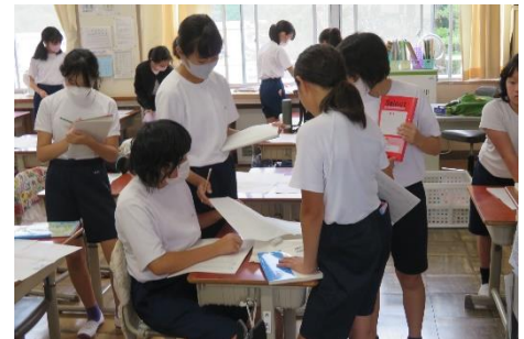
仲間の意見を求めて、聞きに行く

まだ高学年が中心ですが、授業は座って進めるものという概念を振り払い、分からないこと調べたいことがある時や、課題解決の場で仲間の意見を知りたいときに、自分から求めて仲間の席に行き話したり、自主的に小グループを作って意見交流をしたりすることを認めています。慣れてくるにしたがって、意欲的に動くようになりました。もちろん、一人でじっくり考えるタイプの児童もおり、学び方の個性の一つとしてとらえています。