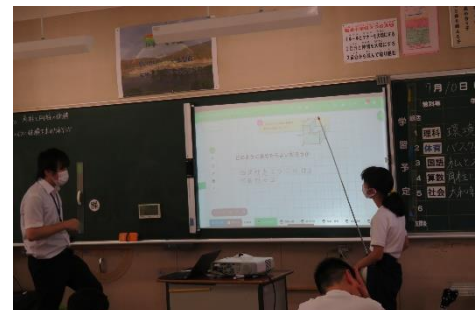
どのように考えたのかを説明する

単に正解を求めるだけでなく、「なぜそうなるのか」「どこに着目するとよいのか」「どういう考え方をするとそうなるのか」といった見方・考え方まで気付くことができるような授業を仕組んでいます。そのために、教師が学習内容を十分に把握したり、子どもの考えを十分に受け止めたりすることができるように研究を進めています。取組を重ねるにつれて、児童も、積極的に「考えること」に取り組むようになってきました。見方・考え方に注目した授業の方が、児童が意欲的に授業に取り組んでいる印象が強いです。