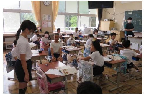
仲間の意見と、比べながら聞く

授業の中で、仲間の話をしっかり聞き取ること、相手に向けて自分の意見をしっかりと伝えることを大切にしています。仲間の意見と自分の意見を比較して聞いたり、時には批判的に聞いたりすることで、考える力を身に付けることに繋げています。また、意見をしっかりと話すことは、自分の意見をより明確にすることに繋がります。