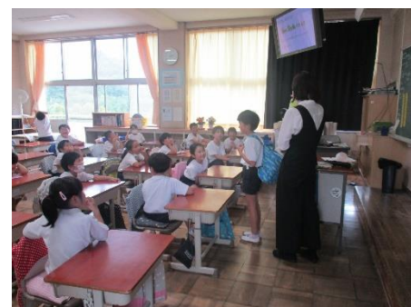
スクールカウンセラーによる SOSの出し方講座の様子

今後も、体作りや運動に自分から積極的に取り組む姿を育てていくとともに、「仲間の気持ちを考えて行動する指導」を進め、安心安全で、楽しい学校生活となるようにしていきます。