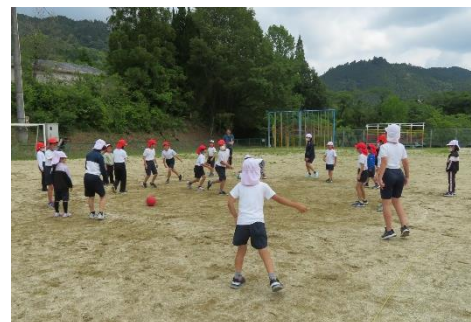
山びこ遊びでの一コマ (全学年の仲間と交流)

今後も、行事など児童が主体的に活動する場を多く準備し、子どもの主体的な姿が生まれるようにしていきます。