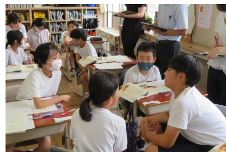
授業中、仲間との対話を通して、意見交流する様子

今後の課題として、自分から疑問に思うことを調べたり、自分の弱点を自分で判断して、家庭学習を中心に学習を進めたりできる姿についても目指していきます。教職員も、児童の学びを支える支援の在り方を研究していきます。