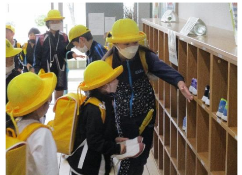
靴そろえを呼びかける高学年の姿