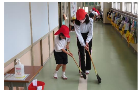
低・高学年のペアで掃除を進める姿